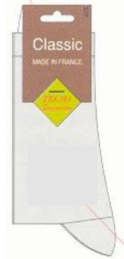
Etiquette pliée en 'V'