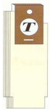
Etiquette pliée en 'U'